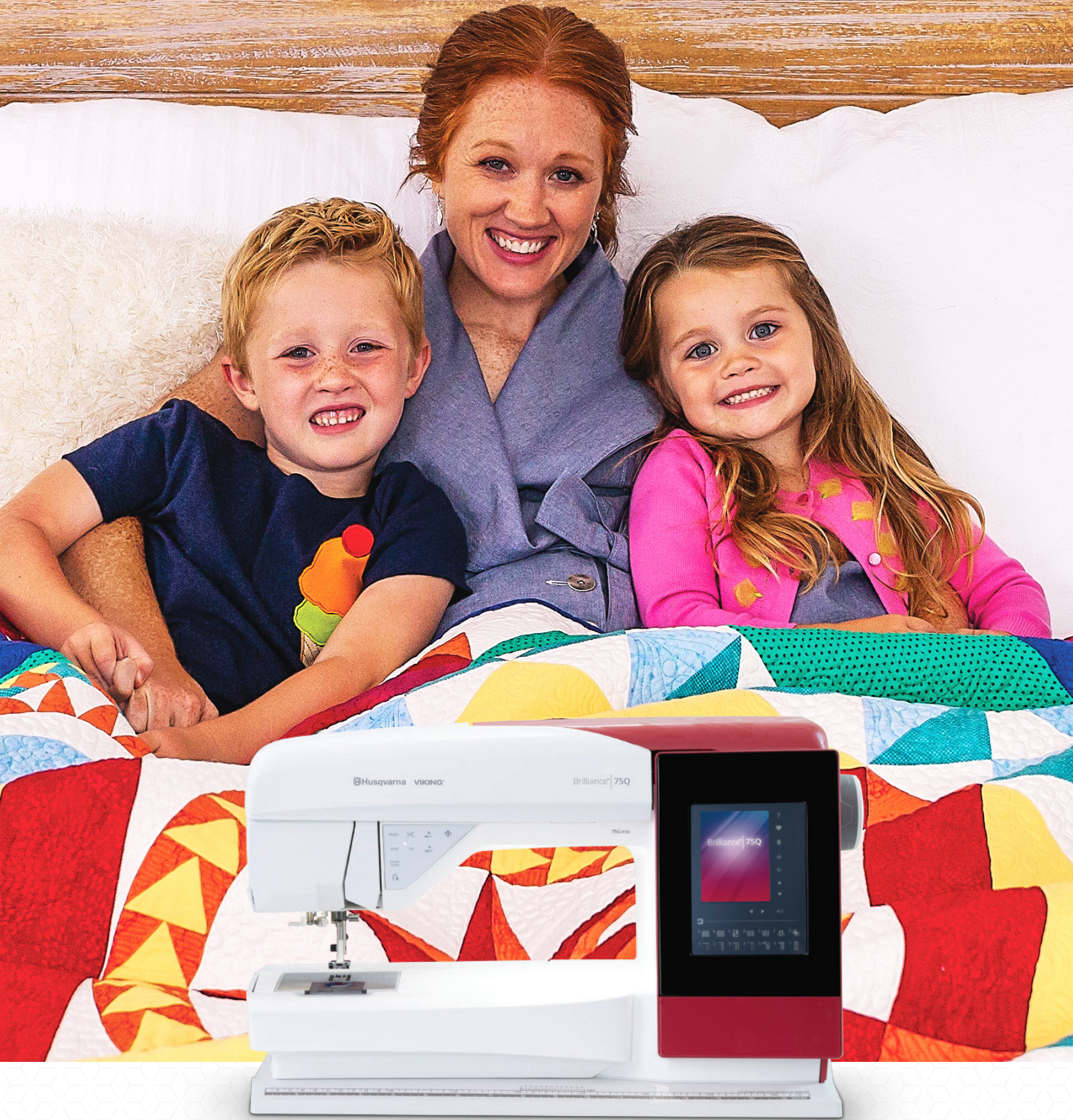
Machine à coudre