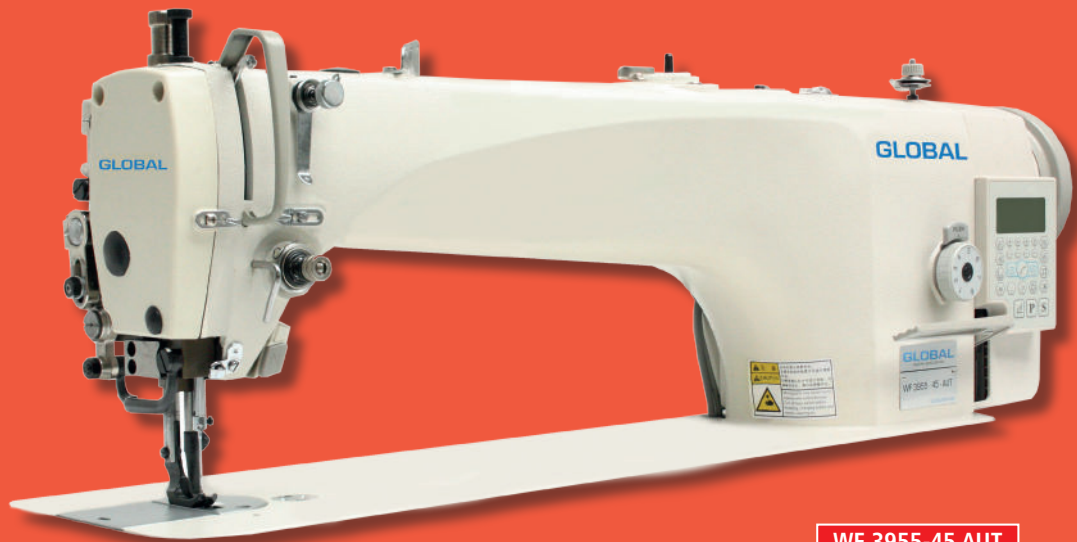
WF 3955-45 AUT