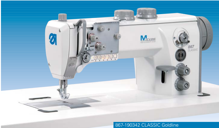
867-190342 CLASSIC Goldline

M-TYPE 867 CLASSIC Goldline – les sous-classes très puissantes