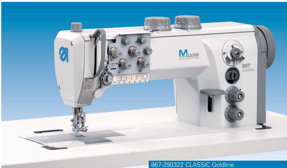
867-290322 CLASSIC Goldline