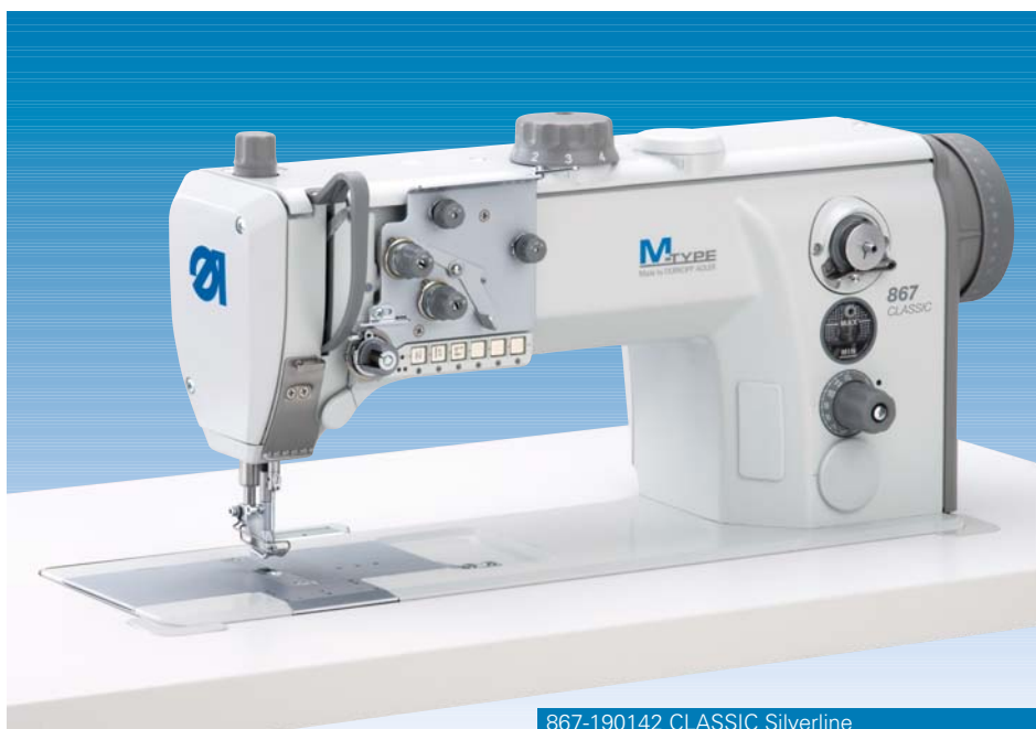
867-190142 CLASSIC Silverline

867-190142 CLASSIC Silverline La machine à base plate, point noué et une aiguille avec entraînement triple est équipée d'un lève-pied automatique, d'une course d'élévation réglable par roue de réglage, des points d'arrêts automatiques, d'un coupe-fil et d'un gros crochet type XXL à axe vertical. Grâce à la canette dont la capacité a été augmentée de 70%, le nombre des changements de canette se réduit presque de moitié.