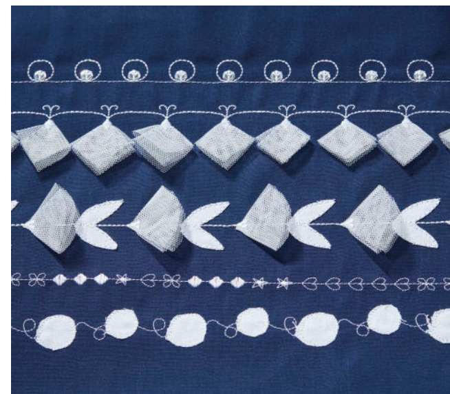
^indique les points brevetés