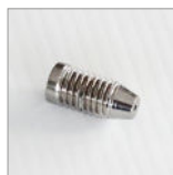
R655 Punta ottone M6 - L 21