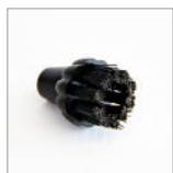
RIP5221 Spazzolino ø25mm M10 - PVC