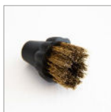
RIP5223 Spazzolino ø25mm M10 - Ottone