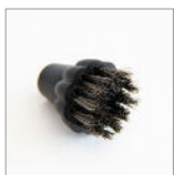
RIP5222 Spazzolino ø25mm M10 - Acciaio