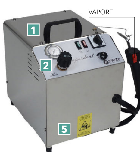
Mod. BF009PV VAPORDENT JUNIOR

Generatore di vapore per pulizia e sanificazione di studi medici/dentistici