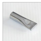
RIP5226 Ugello piatto cromato M10