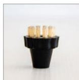
RIP5224 Spazzolino ø25mm M10 - Pekalon