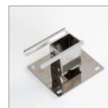
COF5068 Supporto muro pistola vapore